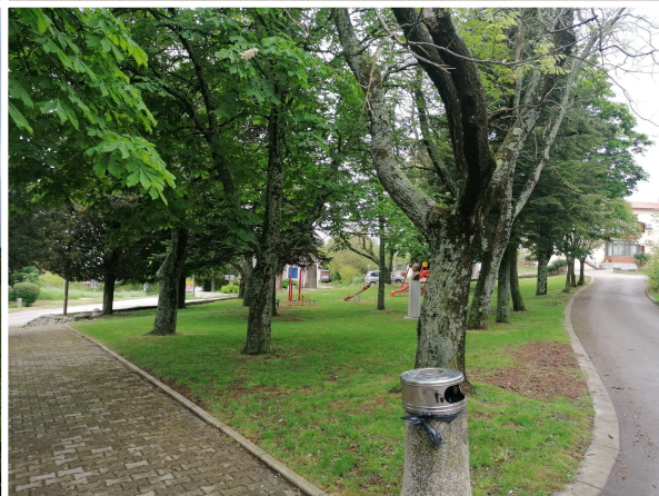
IX IID PPUO Sveta Nedelja Općina Sveta Nedelja Broj ugovora: U-10/2022 Godina: 2023.