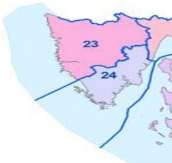
slika broj 1.