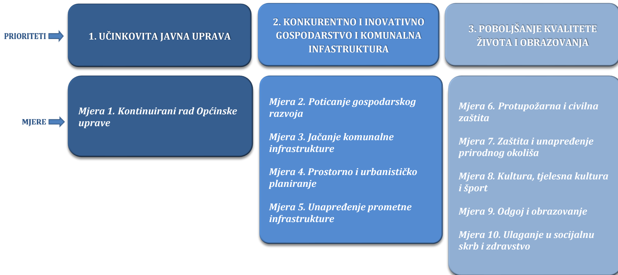
Slika 2. Pregled temeljnih strateških prioriteta i mjera